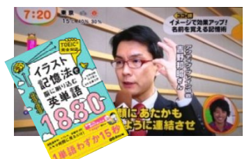
フジテレビ『めざましテレビ』 bayFM・文化放送など出演多数

小学生から80歳のお年寄りまで1000人以上に記憶術を落ちこぼれなくマスターさせ、また、認定講師育成も担当するアクティブ・ブレイン協会のトップトレーナー。また、独自開発した『絵コンテ記憶法』を応用したTOEIC対策講座、ファイナンシャル・プランナー(FP)技能士対策講座などで、暗記という奴隷のような「強制労働」から受講生を一気に解放した。「一人の落ちこぼれも作らない」、「記憶する楽しさと簡単さを、ひとりでも多くの人へ」というモットーを胸に、京都出身らしい優しさに関西人のオモシロさを併せ持つ講義は、元技術者らしく論理的で「まるで方程式を解くように明快」と好評で、修了生から「記憶の救世主」と慕われる。フジテレビの『めざましテレビ』やbayFM・文化放送等出演多数、著書の『イラスト記憶法で脳に刷り込む英単語1880』(あさ出版)はAmazon英単語部門連続8日No.1で品切れ書店続出。